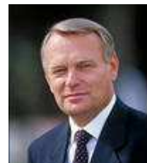
Jean-Marc AYRAULT Député-Maire de Nantes

Bonne chance à tous, Bonne année sportive 2009, Et que le meilleur gagne !